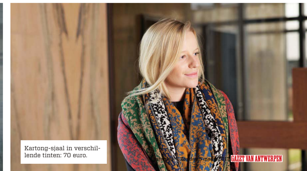
Kartong-sjaal in verschillende tinten: 70 euro.