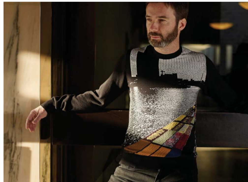
Kyoto-trui met print van foto: 150 euro.