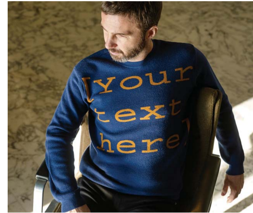
Kobe-trui met print van eigen tekst: 200 euro als je een eigen tekst invoecht, 180 euro met opschrift 'your text here'.