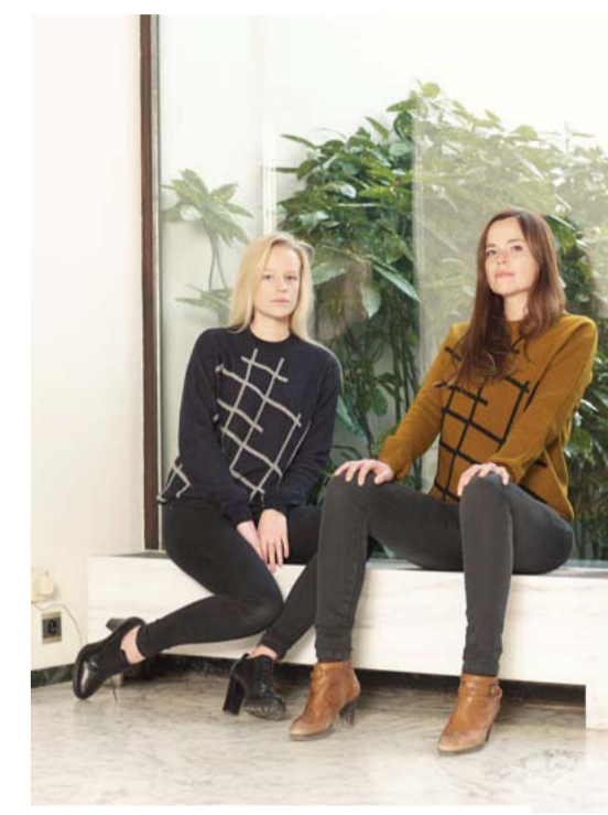
Kopenhagen-trui met ruitmootief: 160 euro.

Met haar customized collectie hoopt Trees vooral modebewuste shoppers aan te trekken die kwaliteit, exclusiviteit en medezeggenschap op prijs stellen. "En uiteraard ook mensen die het belangrijk vinden om kleding '100% made in Belgium' te kopen, want het breigoed wordt van naadje tot draadje in ons atelier in Zottegem gemaakt." En dat is een tijdrovend en arbeidsintensief proces, leren we bij een